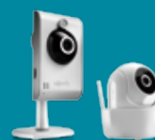
BINNENCAMERA'S VISIDOM ICM100 of VISIDOM ICM100