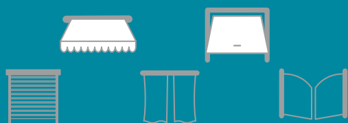
SOMFY GEMOTORISEERDE PRODUCTEN